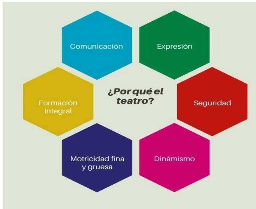
Figura 2 ¿Por qué el teatro? (Canva, 2020)

Fuente: Plan y programas de estudio de nivel primaria básico (Canva, 2020)